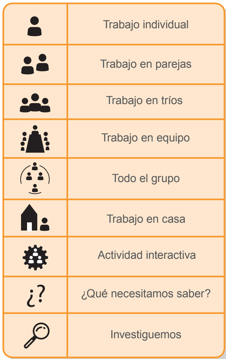
Tabla de íconos

¿para qué sirve? para visualizar y orientar el proceso de aprendizaje. ¿cómo están organizados? * Cantidad de integrantes * lugar donde se desarrolla la actividad * el tipo de actividad